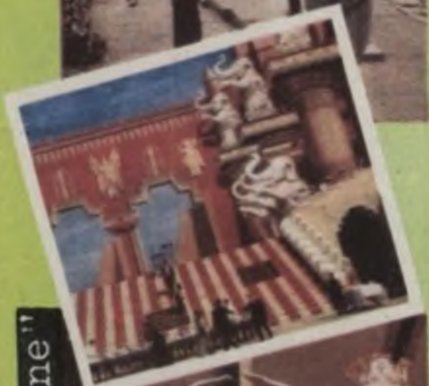
"Good morning Babylon"