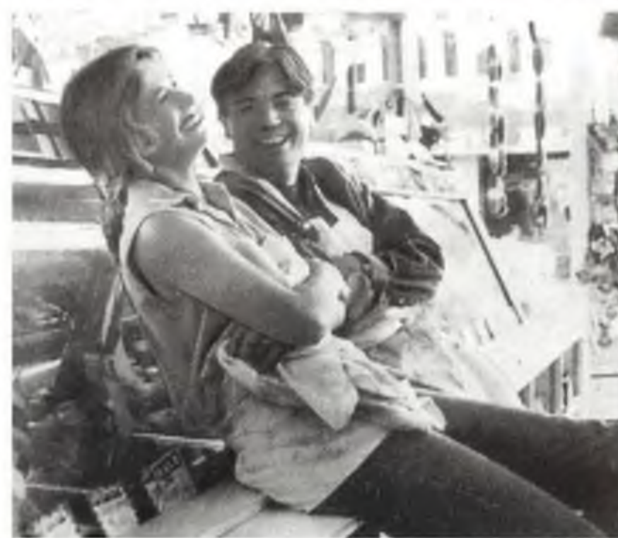
"Парк юрского периода" "Я женился на убийце с топором"