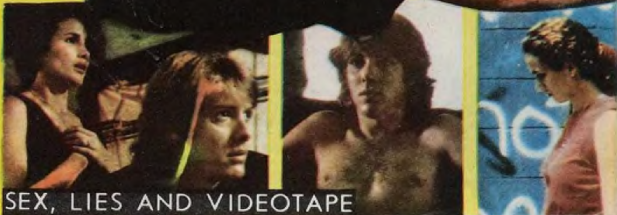
SEX, LIES AND VIDEOTAPE

Предупредим сразу: этот фильм, лауреат «Золотой пальмовой ветви» Каннского фестиваля, не для любителей боевиков, фантастики и прочих киноразвлечений. Его скорее поймут и оценят те, кто любит романы Уильяма Фолкнера, ибо в соперничестве двух сестер, в истории семейной несчастья, в отчаянных поисках правды и любви есть какие-то фолкнеровские интонации. А внешне сюжет выглядит очень просто: в семью преуспевающего молодого юриста приезжает его университетский друг, по всем признакам — человек непристроенный и несчастливый. Жена юриста мучается от одиночества и непонятости, сам юрист забавляется с сестрой жены и т. п. Но явление чужака открывает дорогу к правде и любви.