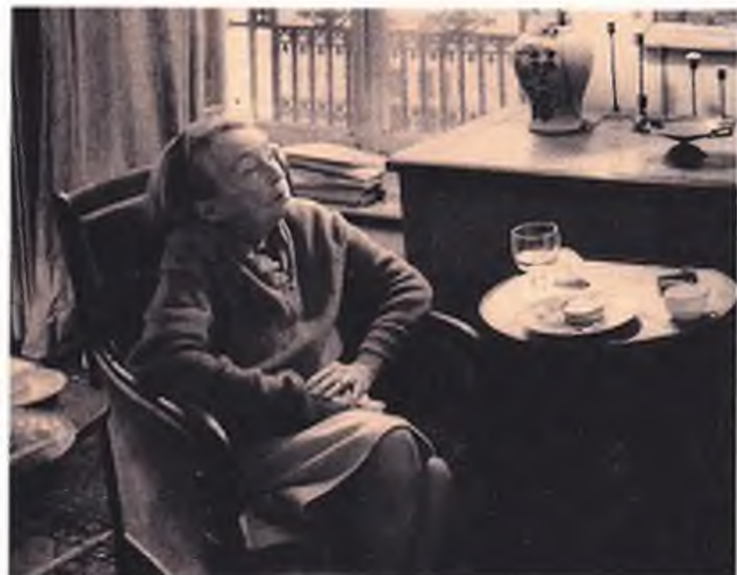
“По-моему, Маргерит Дюрас интересна и притягательна прежде всего своим отношением к жизни”, — заметил по поводу её произведений Франсуа Миттеран.

“Она ставит в тупик. В то время как другие большие писатели нашего времени скорее склонны указывать нам путь, вести за собой, взяв за руку, Дюрас унит нас тому, как заблудиться. Она накинута на вторую половину XX столетия страшный покров, принадлежащий ей одной, безраздельно. Вот почему так трудно ее классифицировать. А попытка “рассказать Дюрас” подобна авантюре...” “Цувель обсерватор”