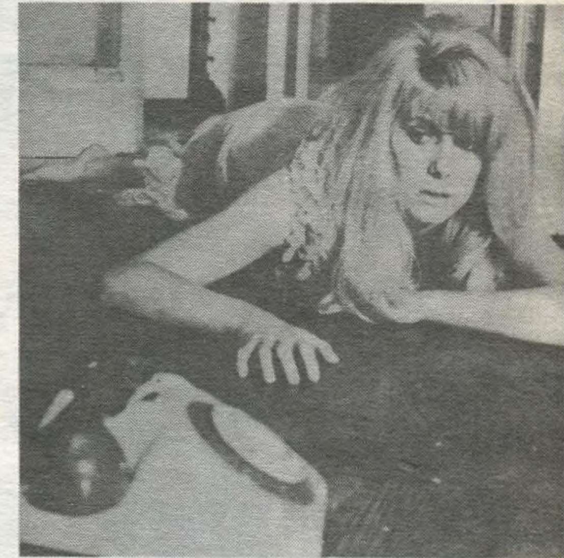
Катрин Денев в фильме "Отвращение"

С таким мироощущением он принимается за новую работу, на первый взгляд, не имеющую ничего общего с его собственной жизнью и в то же самое время рифмующуюся с ней по самому главному — картину