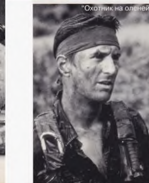
«Охотник на оленей»