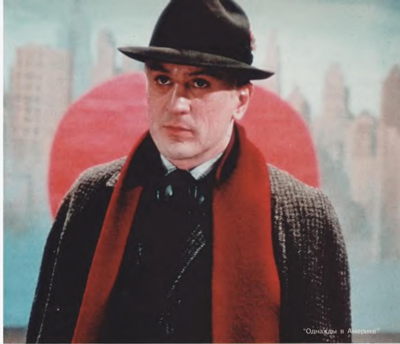
«Однажды в Америке»

В 1953 году, когда ему было 10 лет, Де Ниро уже твердо знал, кем хочет стать, начав учебу в драматической мастерской, а в шестнадцать — переступил порог Актерской студии Ли Страсберга.