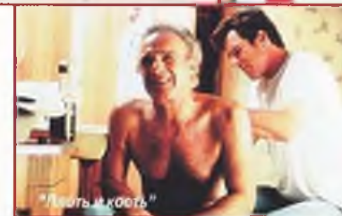
"Лететь и копать"

сознания. Так, во всяком случае, мы полагали тогда. Но без этого добра живется намного лучше.