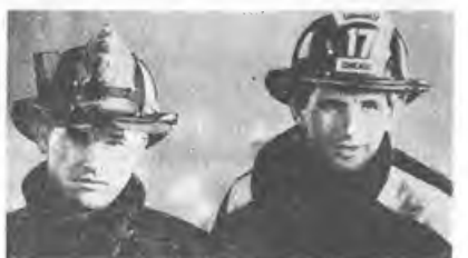
«Огненный вихрь» (Backdraft) 1991, 120 мин. Реж. Рон Ховард. В ролях: Курт Рассел, Уильям Болдвин, Роберт Де Ниро, Скотт Глени, Дженифер Джейсон Ли, Ребекка Де Морней, Д. Сазерленд.

первых мест в хит-парадах по обе стороны Атлантики. По данным журнала «Screen International», рейтинг картины соответствует 24-ому месту — 47 миллионов долларов на 13 декабря 1991 года.