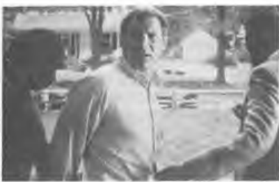
«Презумпция невиновности» (Presumed Innocent) 1990, 128 мин. Реж. Алан Джей Пакула. В ролях: Харрисон Форд, Брайан Деннехи, Раул Джулия, Бонни Беделли, Пол Винфилд, Гретта Скакки.

Можно сказать, что это — производственный фильм, а можно — детище Джорджа Лукаса. Фирма по производству кинотрюков, пожалуй, очередной раз отличилась: огонь в фильме, стараниями инженеров фирмы, превращен в настоящее хищное существо. По сведениям журнала «Screen International», на 13 декабря 1991 года картина занимает 11-ое место по сборам — 77 миллионов долларов.