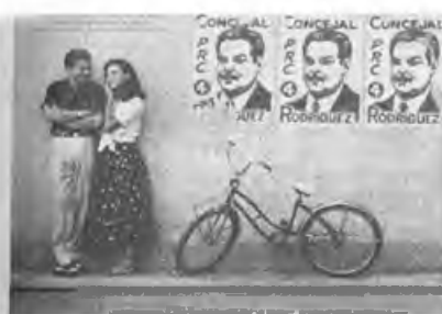
«Гавана» (Havana) 1990, 145 мин. Реж. Сидней Поллак. В главных ролях: Роберт Редфорд, Лена Олин, Рауль Джулия, Алан Аркин, Томас Милан.

Последний месяц перед падением Батисты. Профессиональный игрок Джек Вейл (Роберт Редфорд) помогает встретиться им на пароме девушке провести некий нелегальный груз из Ки Веста на Кубу. Роберта (Лена Олин — бесподобная Сабина из «Невыносимой лег-