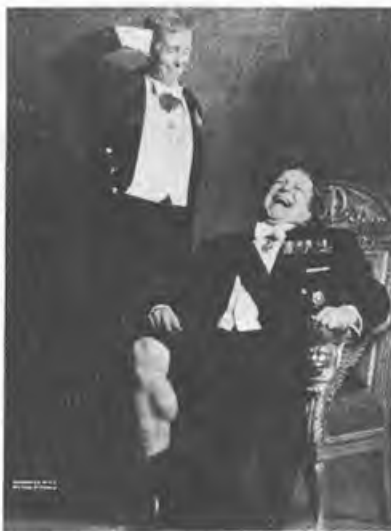
«Лестница Джейкоба» (Jacob's Ladder) 1990, 113 мин. Реж. Эдриан Лайн. В ролях: Тим Роббинс, Элизабет Пенья, Денни Анзелло, Мэтт Крейвен, Прюит Тейлор Винс.

«Король Ральф» (King Ralph) 1991, 97 мин. Реж. Дэвид С. Уорд. В ролях: Джон Гудман, Питер О'Туа, Джон Херт, Камилла Гудури. Комедия. Английскую королевскую семью убивает электрическим разрядом от вспышки во время фотосъемки. Естественно, возникает вопрос о престолонаследии. Будущего монарха находят в Америке — им оказывается толстяк Ральф, артист кабаре на полставки.