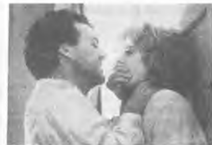
«Соревнование родственников» (Sibling Rivalry) 1990, 87 мин. Реж. Карл Райнер. В ролях: Кирсти Элли, Билл Пакстон, Кэрри Фишер, Джамал Герц, Скотт Бакула, Сэм Эллиот, Эд О'Нейл.

Майкл Китон играет в этом фильме Картера Хайеса (он же — Джон Дефорт), странного авантюриста, который подселается в обеспеченные дома и при помощи различных неблагоприятных манипуляций выкуривает оттуда владельцев. Судя по всему, странность героя объясняется его шизофре-