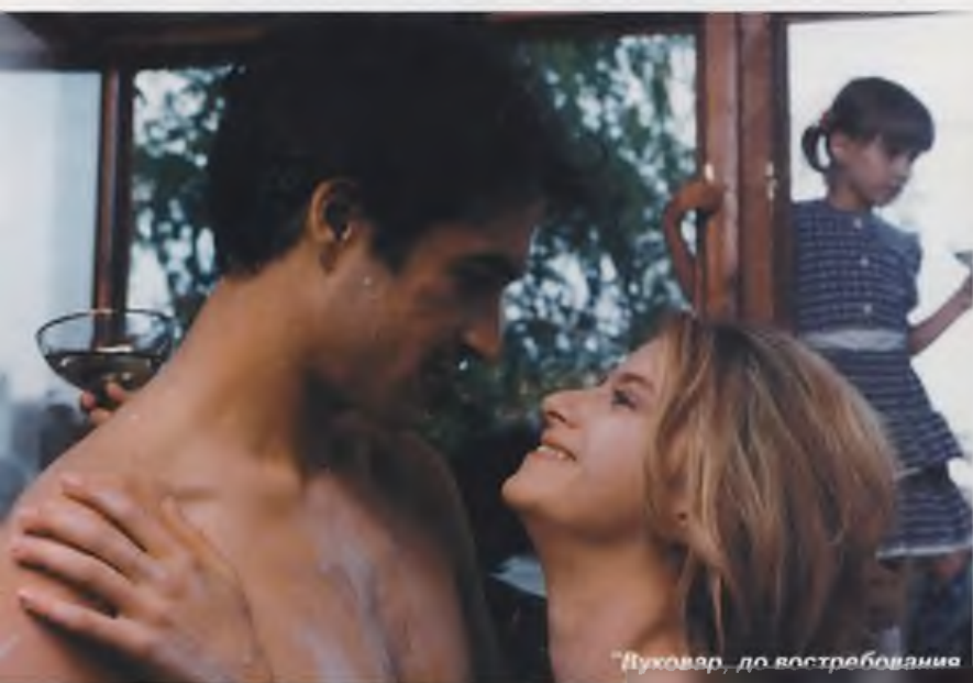
"Вуковар, до востребования"

Информационная (внеконкурсная) программа является второй по значимости на XIX МКФ. В нее войдут наиболее интересные картины ведущих режиссеров мира (как правило с участием звезд первой величины), которые по регламенту не могут участвовать в конкурсном показе, поскольку они награждены или принимали участие в других международных конкурсах, или вышли ранее 1994 года.