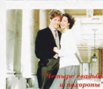
Четыре свадьбы и похороны