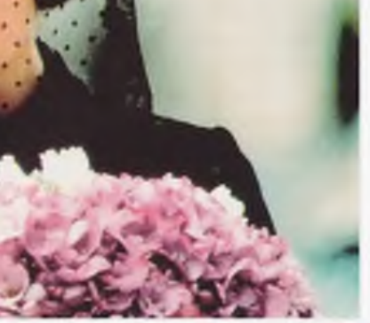
Подними красный фонарь

жение своего "Двадцатого века", по моему, недооцененной исторической фрески с вердиевским трагизмом. Как доказывает и новая работа братьев Тавиани (они тоже тво-