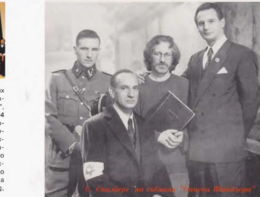
С. Спилберг на съемках "Списка Шиндлера"

рантино в список "Ста эталповых фильмов мирового кино", впрочем, как и "Список Шиндлера", дошедший до нас тоже в 1994 году. Многие отнеслись к работе Стивена Спилберга с предубеждением и исходя из каких-то сиюминутных, случайных настроений, даже определенного раздражения из-за нового усилителя "короля суперзрелищного кинематографа", который на этот раз покорила и другую Верг,