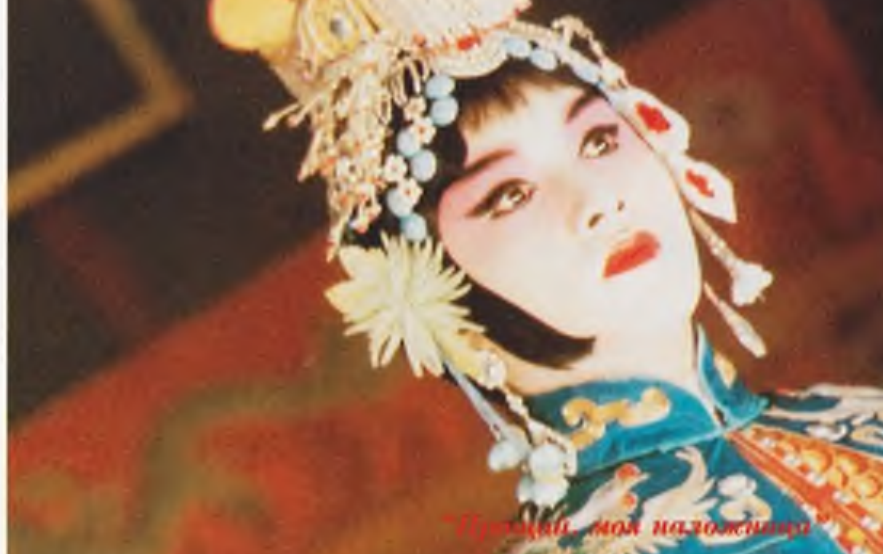
Прощай, моя наложница

рять неровно, но во "Флореале" приближаются к высотам таких своих лучших картин, как "Аллонзанфан", "Ночь святого Лоренцо" и "Хаос"), и телесериал "Благие намерения" датчанина Билле Аугуста (киновариант получил главный приз в Канне-92), снятый по семейному роману гениального шведа Ингмара Бергмана, культурная традиция поэтически-эпического преобразования интимно-бытовых историй может принести замечательные плоды. Но режиссеры рискуют потерпеть художественное поражение, обращаясь с той же методикой