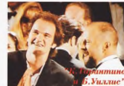
Квентин Тарантино и Б. Уиллис