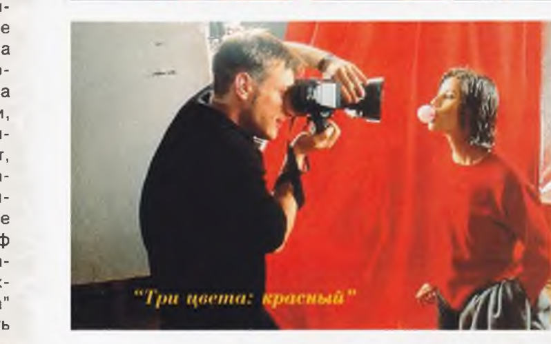
Три цвета: красный