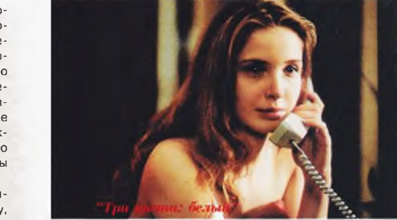
Три цвета: белый

завоевав 7 "Оскаров" (а до этого не имел ни одного, за исключением почетной премии имени продюсера Эрвинга Талберга — еще один "горец", судя по фамилии — за творчество в целом). Но значение спилберговского достижения в "Списке Шиндлера", по моему, в должной мере может быть оценено лишь впоследствии, через годы и десятилетия. Среди других фильмов, появившихся на видео в 1994 году, я бы отметил "Короткий монтаж" и "Готовое платье", две последние картины Роберта Олтмена, можно с уверенностью сказать, живого классика американского кино, к стати, отмечающего свое семидесятилетие как раз в тот момент, когда журнал с этим материалом должен выйти в свет. Олтмен выстраивает причудливые киномазки, а поляк Кшиштоф Кесьлевский — стройные, тщательно продуманные киноциклы, в частности, "Три цвета" (правда, пока на кассетах есть