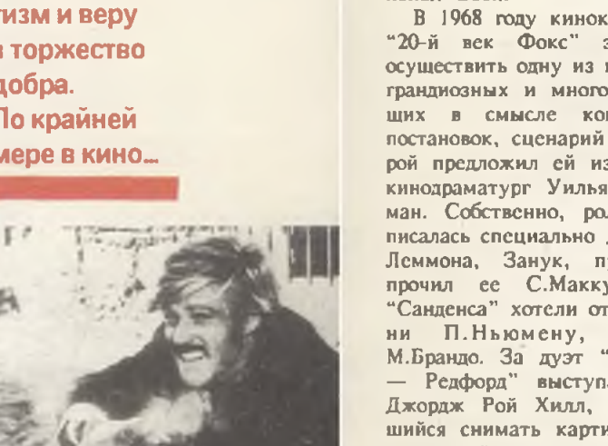
«звезда», одна из которых уже давно «сизала», а другая еще не думала «зажигаться».