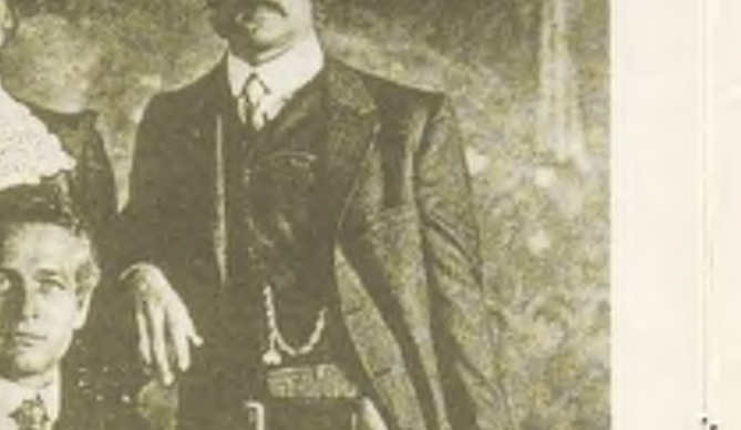
«он никогда не любил кино: «Зачем искусственное небо, если есть настоящее?» — вопрошал Рэдфорд.