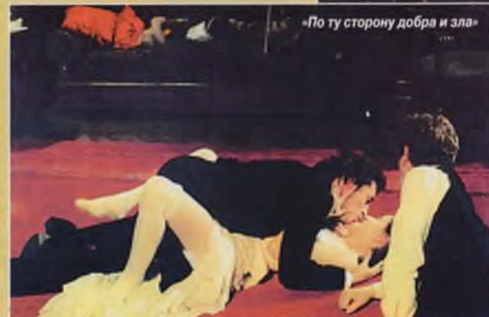
«По ту сторону добра и зла»

всеми существующими во мне эмоциональными силами дать физическое присутствие его. Для меня было изнуряющим испытанием играть того, кто уникален и является бесконечностью, означая — весь мир». Стилистика Дзеффирелли в этом фильме напоминает старую живопись, кадры дышат теплой золотой охрой. Достоверность происходящего так влияла на членов группы, что многие из них обратились в веру. Жители марокканских деревень, где проходили съемки, не сомневались в том, что началось второе пришествие. Они боялись поднять глаза на Пауэлла, бросались на колени перед ним, приносили ему дары. На съемках сцены распятия произошло знаменательное событие. Плохо укрепленный в землю крест с высоко висящим на нем актером пошатнулся, накренился, и актер на мгновение испытал страх неминуемой гибели. Это помогло ему почувствовать Христа как живое, истерзанное и умирающее человеческое существо.