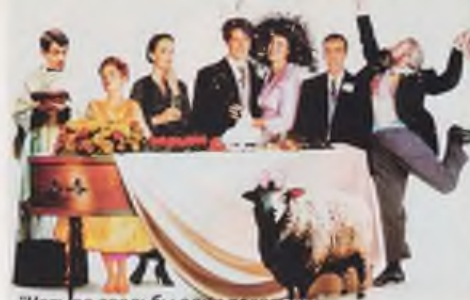
"Четыре свадьбы и одни похороны"

Британская киноакадемия чуть-чуть поправила Американскую и в связи с "Криминальным чтивом" (номинантом в девяти категориях) Квентина Тарантино, который, кстати, был в тот момент в Лондоне, но послал на церемонию своего соавтора по сценарию Роджера Эйвари, получившего, как все и ожидали, вслед за "Золотым Глобусом" и "Оскаром", еще одну награду за действительно оригинальный во всех смыслах сценарий. Но помимо этого, Сэмьюэл Л. Джексон, сыгравший чернокожего гангстера-лжепророка, отмечен