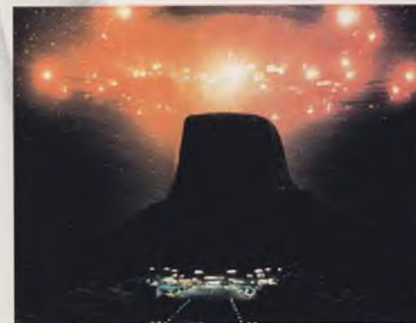
"Ближние контакты третьего вида"