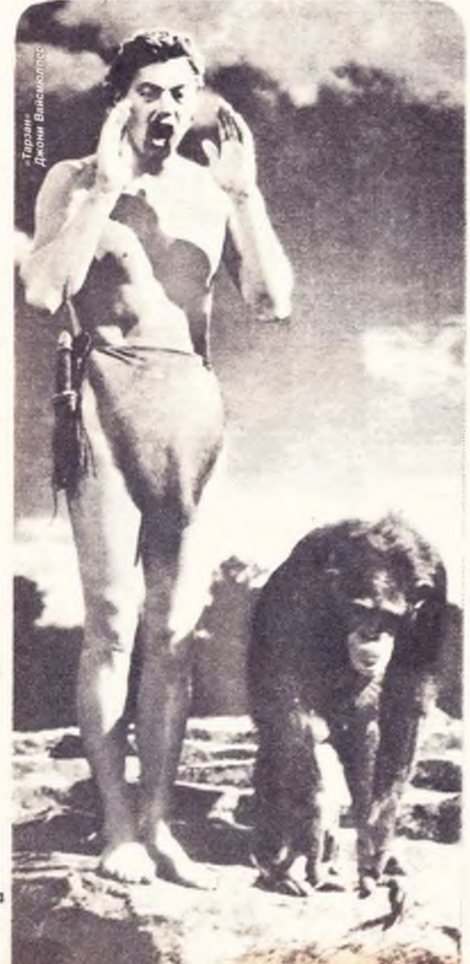
Тарзан Джонни Вайсмоллер

Иосиф МАНЕВИЧ Публикация Е. И. Вельяминовой