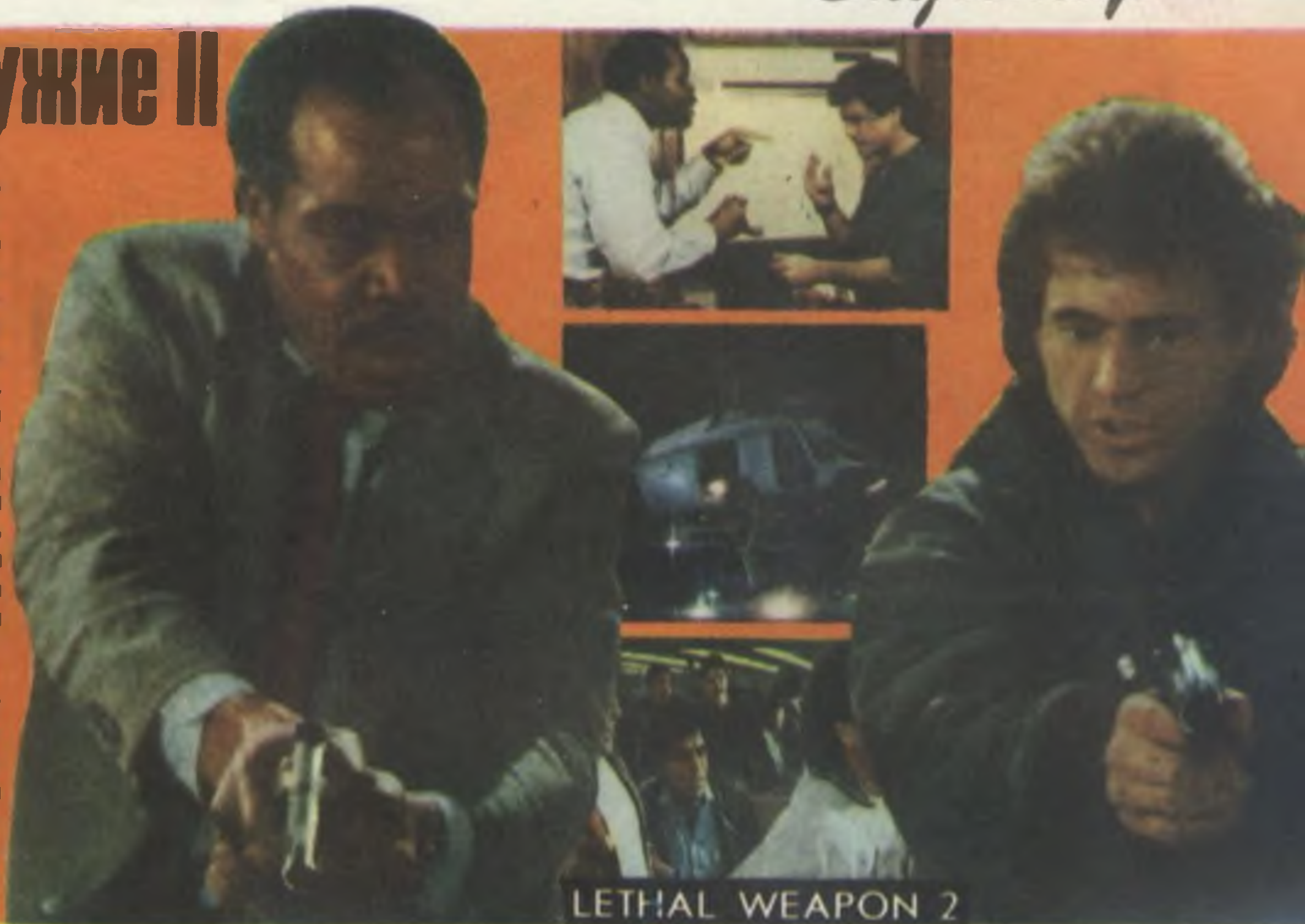
LETHAL WEAPON 2

Ю Опус № 2 сильно уступает первому уже потому, что сюжетные ходы часто повторяются. По всей видимости, создатели «Оружия» намереваются в дальнейшем проэксплуатировать сюжет до состояния много-много-серийного телефильма.