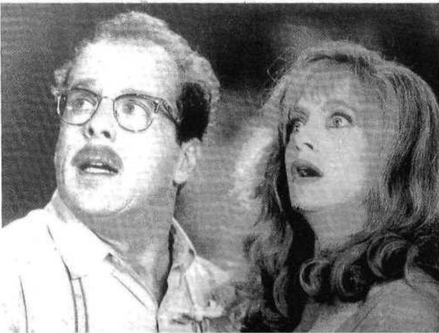
«Смерть ей к лицу»

Грандиозные метаморфозы происходят и с Хелен, которую Голди Хоун сыграла в фантазмагорической комедии «Смерть ей к лицу». Хелен, у которой ее лучшая подруга отбивает жениха, опускается. Свои страдания она пытается заглушить чрезмерно, отчего ее фигура достигает невероятных размеров (великолепная работа мастера по спецэффектам и гримера), а затем, преодолев депрессию, чудесным