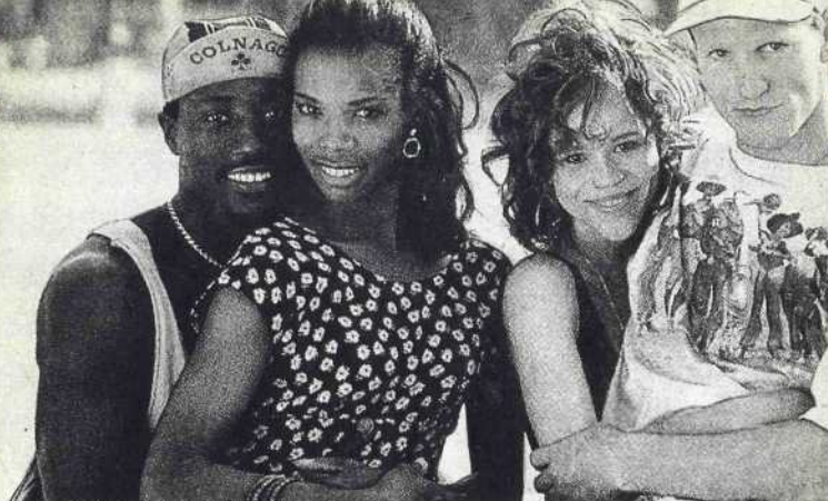
«Белье прыгать не умеют»

ванно сыграть не просто преступника, а полусумасшедшего маньяка, совершающего целую серию убийств. Именно такую роль сыграл Харрелсон в «Прирожденных убийцах», новом фильме Оливера Стоуна. «Я родился его персонаж, совершающий ряд кровавых убийств и нарушающий любые правила и нормы, принятые в нормальном обществе. «Этот фильм — попытка путешествия в самое сердце тьмы, которая оказывает сильное влияние на всех окружающих. Перед началом и во время съемок я постепенно погружался и изучил достаточное количество книг и видеоматериалов о маньяках, совершавших массовые убийства. Не думаю, что какая-либо из предыдущих ролей требовала от меня подобных усилий. Кроме того, мне пришлось для себя выяснить степень своей агрессивности и потенци к злу, тающиеся в моем сознании», — рассказывает Харрелсон.