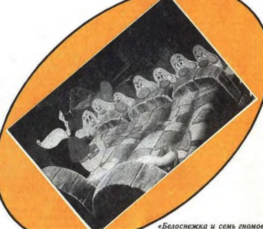
«Белоснежка и семь гномов»

основанную на сильной исполнительской власти. Не последнюю роль будет играть в ней Джо Рот, который участвовал в таких успешных проектах как «Один дома» (Home Alone), «Крепкий орешек II» (Die Hard II) и «Миссис Даутфайр» (Mrs. Doubtfire). Он может иметь успех в производстве игрового кино, но как быть с анимацией? Многие волнуют, что Рой Дисней не сможет что-либо противопоставить коммерческим хитам Катценберга. В этой связи можно вспомнить, что последний мультфильм Роя «Черный котел» (Black Sails) был провальным, но именно он, племянник Уолта, заложил основы для дальнейшего процветания компании. Тем не менее студия берется за производство «бывших проектов Джеффри»: «Геркулес» (Hercules) режиссеров Джона Маскера и Рона Клемента, снявших «Алладина»; «Горбун Соборной Парижской Богоматери» (The Hunchback of the Notre Dame), который будут озвучивать Демми Мур и Том Хэлпс, и «Покахонтас» (Pocahontas) об индейской принцессе XVI века. Это все были любимые чада Катценберга, а роды будут теперь принимать Рой Дисней, среди планов которого сидел его великого дяди «Фантазия продолжается» (Fantasia Continues). Джеффри также «перелопачивает» Руперта Мердока и