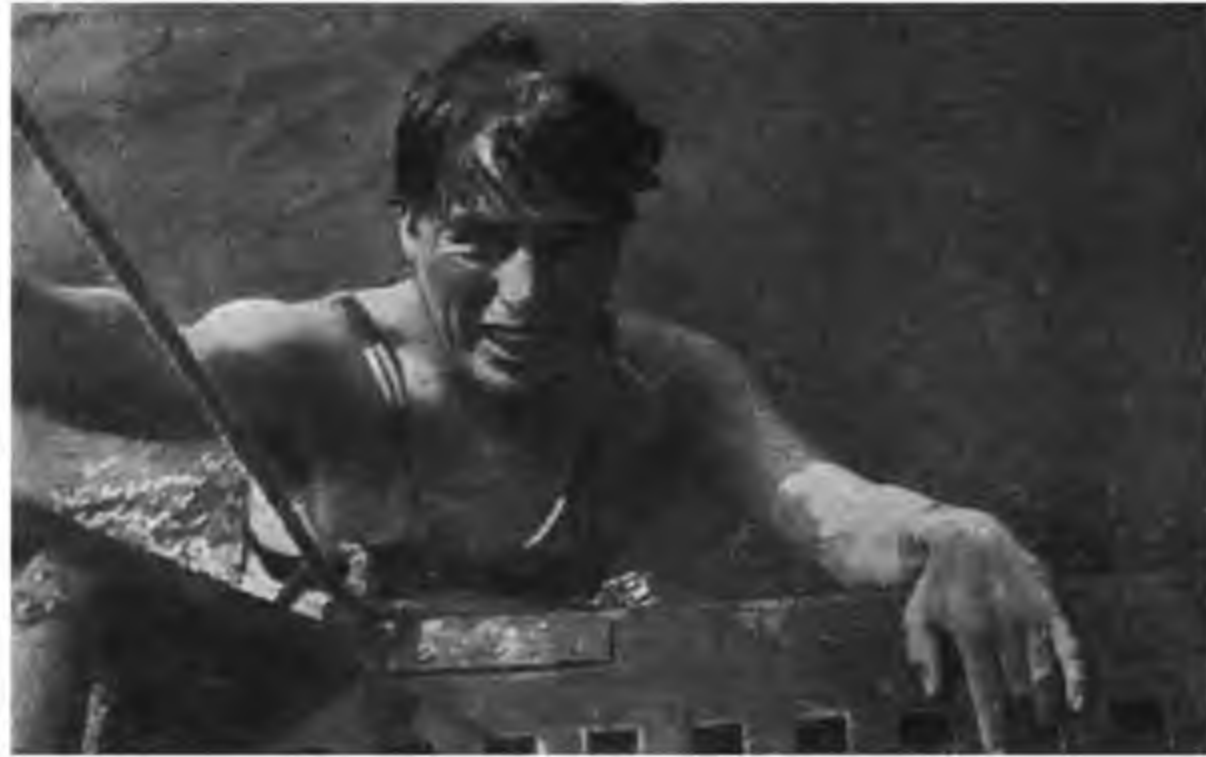
Чаплин в Голливуде. Фото сделано Г. Александровым в 1930 году

Когда Чаплина спросили, почему он делает фильм «Великий диктатор», артист шуточно ответил: «Потому, что Гитлер украл у меня усники...» Потом серьезно объяснил: «Этот фильм я сделал потому, что видел вокруг себя в Америке страшную апатию, в то время как нацизм наводил мир. Это меня беспокоило, я был охвачен ужасом. Нужно было что-то делать».