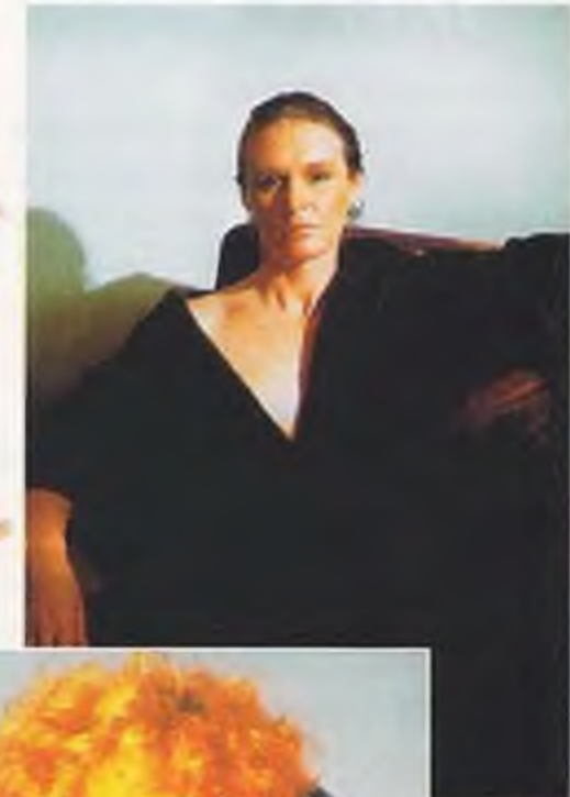
"Встреча с Венерой"

ла, что Гленн Клоуз никогда не говорит о самой себе в единственном числе, но только как о части поколения. Вновь и вновь наш разговор возвращается к ее друзьям по профессии — Мерил Стрип, Мэри Бет Херт, Кевину Клайну, Билу Херту, Мэнди Патинкину, Джо Бет Уильямс. Одна из ее важнейших особенностей состоит в том, что она с равным успехом работает как на театральных подмостках, так и в кино. Она полноправная представительница этого первого поколения американских актеров, сделавших полноценную карьеру в двух видах искусства. Особенно близко две сферы творческой деятельности актрисы сошлись в "Гамлете", где она воплотила королеву Гертруду. Судьба Гленн Клоуз в искусстве в целом сложилась удачно. Актриса сумела преодолеть неблагоприятное начало своей карьеры и показать все, на что способна. Это подтверждают и ее последние работы в "Доме духов" и "Газете".