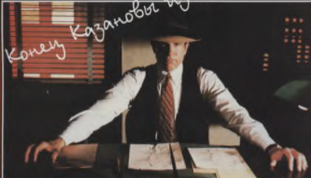
За тридцать лет он умудрился соблазнить половину Голливуда. Начиная от Джона Колмана в конце Ма-донной ни одна не сумела сказать ему «нет». И ни одна не сумела уговорить его стать отцом.

«Если существует реинкарнация, то в следующий раз мне бы хотелось родиться в шкуре Уоррена Битти», - заявил в одном интервью Вуди Аллен. Уоррен Битти знаменитый актер и известный режиссер. Но вовсе не эти шари не дают спать неподражаемому Вуди. Такого у него и самого хватает. Но вот слава Уоррена Битти как соблазнителя и соперника, действительно, можно позавидовать. И все же когда голливудскому любимому исполнилось 55 лет, это случилось, Уоррен Битти - отец! Просто абсурд! Никто в Голливуде не хотел этого, верить. Никто не мог представить его в этой роли. На его лице эгоистичный, но дриль режиссеров, которые в бесконечной цепи его любовниц - аватары всегда находили источник для писанных подробностей. Даже его сестра Ширли Мак Лейн, которая в своей автобиографии еще недавно характеризовала его как мужчину, который не выносит никаких ограничений. Дети и семья обещали бы, что он должен нести за что-то ответственность. Это он-то, который был неспособен приспособиться даже ко времени общего ужина?