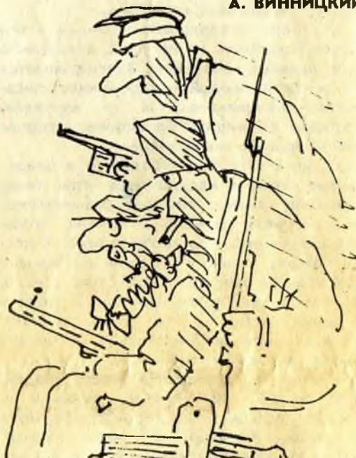
Рис. В. Богорада