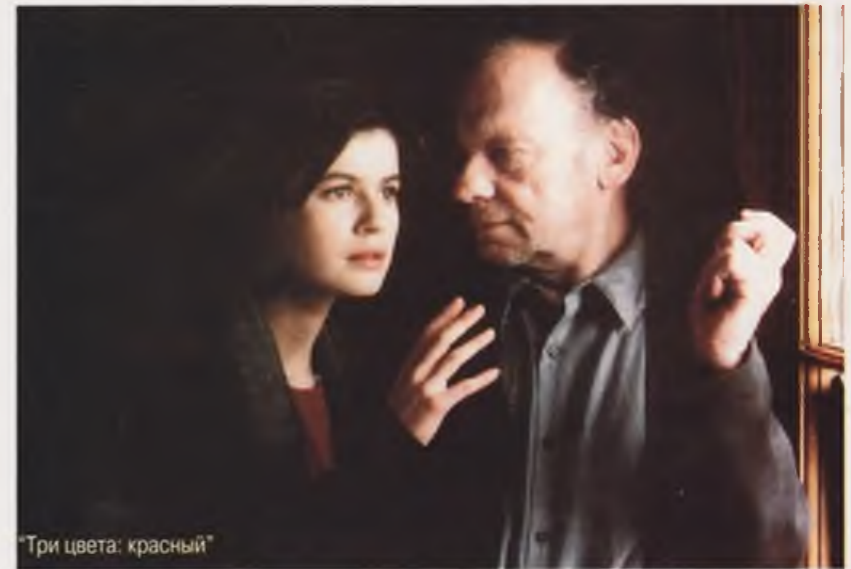
"Три цвета: красный"

По материалам парижского корпункта "Видео-Асс"