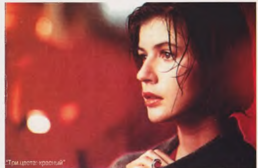
"Три цвета: красный"