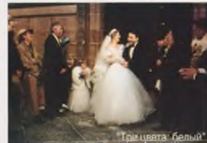
"Три цвета: белый"