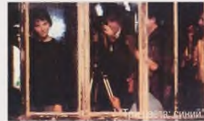
"Три цвета: синий"