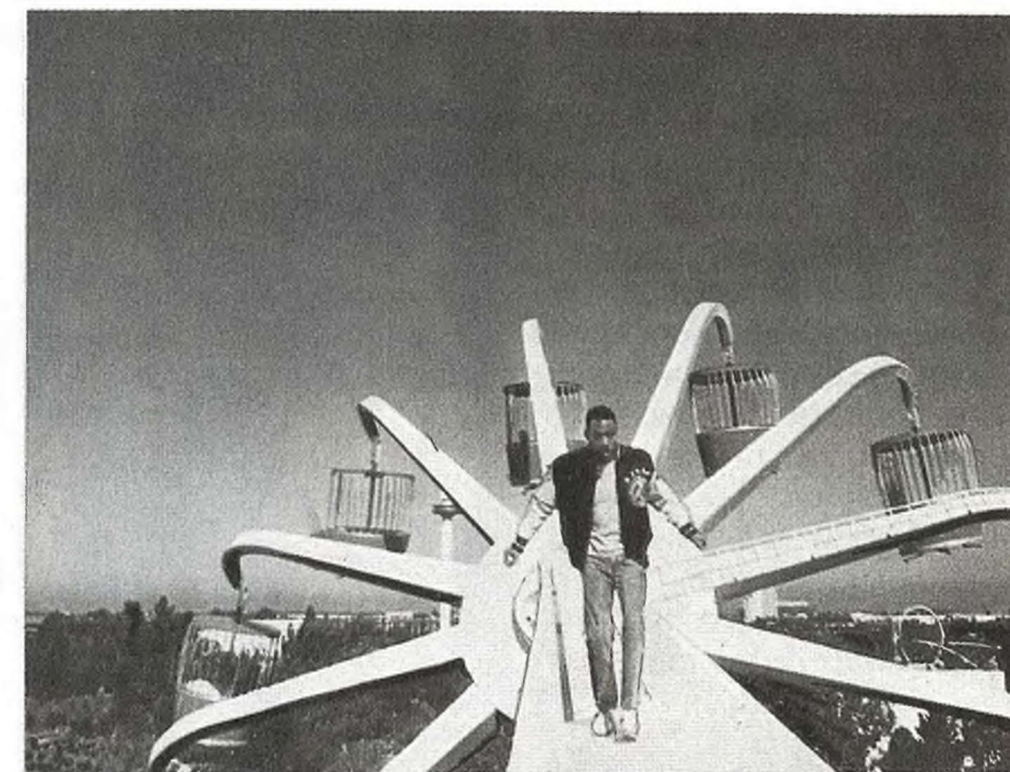
«Полицейский из Беверли-Хиллс - 3»

В Голливуде, до недавнего времени принято было считать успешным сиквелом тот, который собрал 60% от дохода своего предшественника. Однако с каждым годом производство фильмов-продолжений неуклонно дорожает, и в первую очередь, из-за того, что бессменные звезды сериалов постоянно увеличивают свои гонорары.