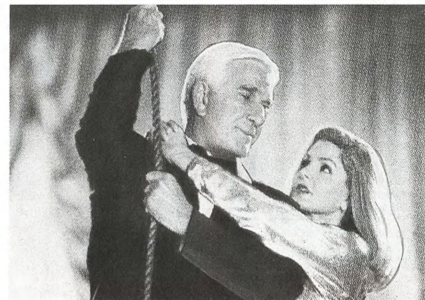
«Голый пистолет 331/3»

бопытство — это одно из самых неистребимых качеств человеческого характера и вечно тревожащий заинтригованного зрителя вопрос «а что будет дальше?» продолжает будоражить сознание людей всех возрастов.