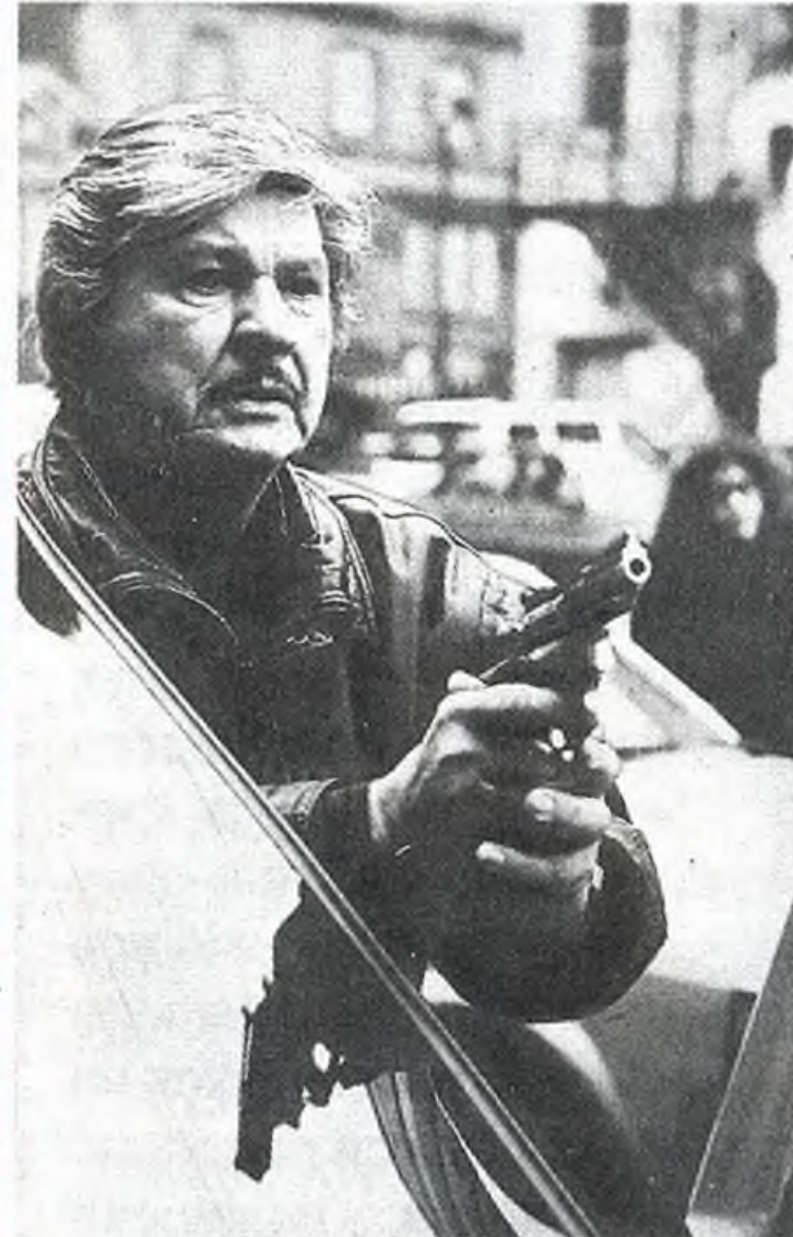
«Жажда смерти - 5»

(«Беглец»). Время покажет, насколько эти знаменитости оказались правы.