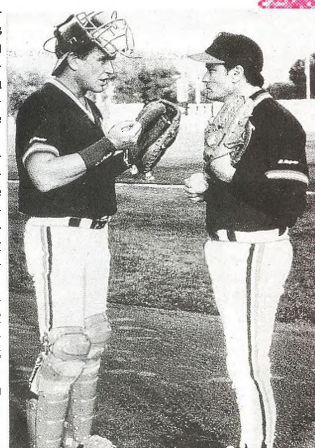
«Высшая лига - 2»

«Робокоп-3» — все потерпели сокрушительный провал. Рождество и начало 1994 года также принесли разочарования создателям сиквелов. «Сокровища семейства Аддамс», «Мир Уэйна-2» и «Сестра в действии-2» не оправдали возлагавшихся на них надежд. Практически незамеченными остались «Белый клык-2», «Лепреккон-2» (1,5 млн), «Моя дочь-2» (17 млн) и «Жажда смерти-5» (1,5 млн).