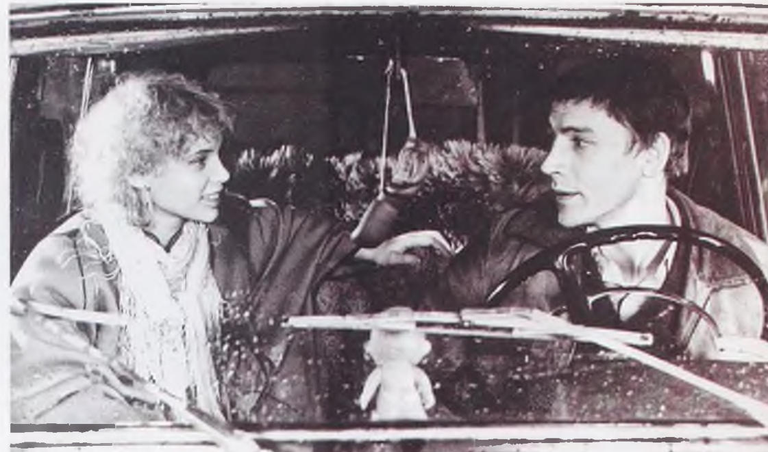
«Милый, дорогой, любимый, единственный»

Я родился в Белогорске Амурском, аттестат получал в Благовещенске, занимался в народной театральной студии при Амурском драмтеатре, институт искусств заканчивал во Владивостоке, потом был театр в Уссурийске. Это только места, где я жил, а где «бывал» — без счета: отец работал железнодорожником на лесозаготовках, так что иной раз жили мы в таких поселках, по улицам которых ногами медведи ходили. Помню, был городок, в котором шиты баскетбольные стояли, а играть никто не играл — ребята правил не знали. У меня до сих пор жуткий комплекс провинциала; вот играет, скажем, классическая музыка, а я ее не понимаю — где мне ее понять-то было? В Сивках? В Шимановске, в котором было два аккордеона на весь городок? Не-е, «комплекс» свой я осознал и понять пытался: а вдруг «там» и