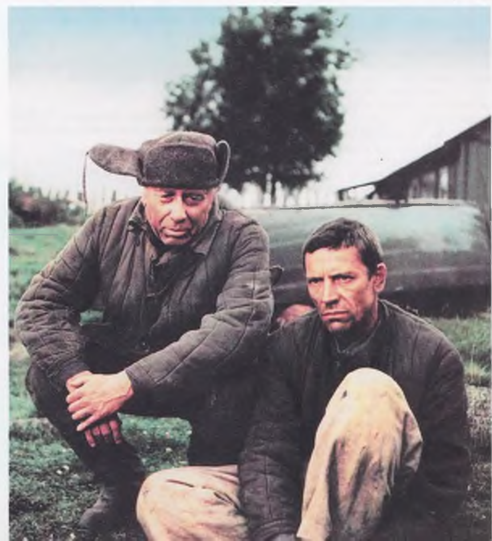
«Холодное лето пятьдесят третьего...»

вправду что-то есть? Хотя до сих пор не понимаю, кто душевно тоньше: тот, кто на симфоническом концерте сидит закрыв глаза, или тот, кто слушает петуха на заре, тишину на утренней рыбалке?! Иностранцы, пытающиеся судить о России только по столице, ни в малой степени ее не поймут. Реформаторы, по-столичному лихо пытаюсь сконструировать будущее, не принимают во внимание провинцию, а ведь она существу-