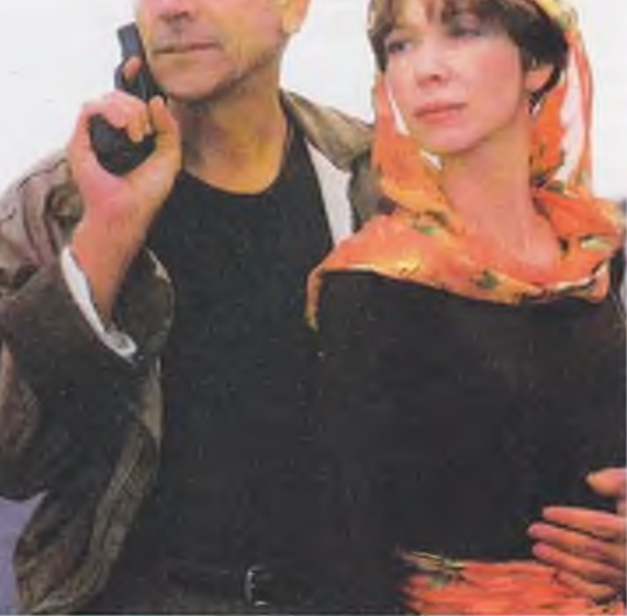
«Время печали еще не пришло»

А это распространившееся поветрие кричать о своей «родовитости». Оказывается, половина москвичей в прошлом в своих усадьбах чай распивала, другая же — в дворянских чашках с советской властью организованно боролась. Так кого же тогда на конюшнях секли!