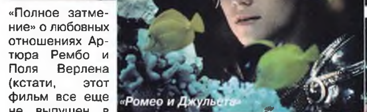
«Ромео и Джульетта»