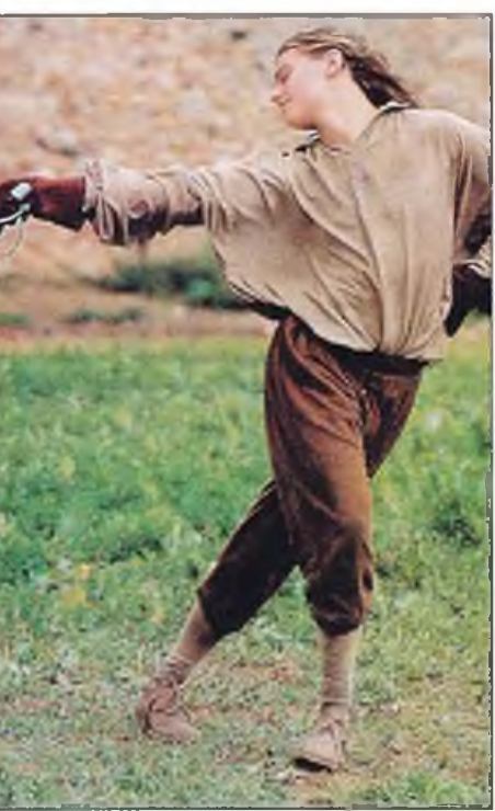
Во время съемок фильма «Человек в железной маске»