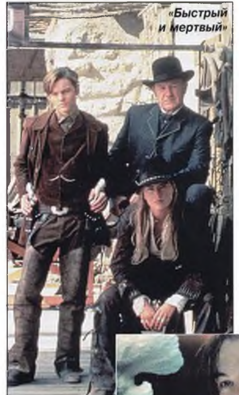
«Быстрый и мертвый»