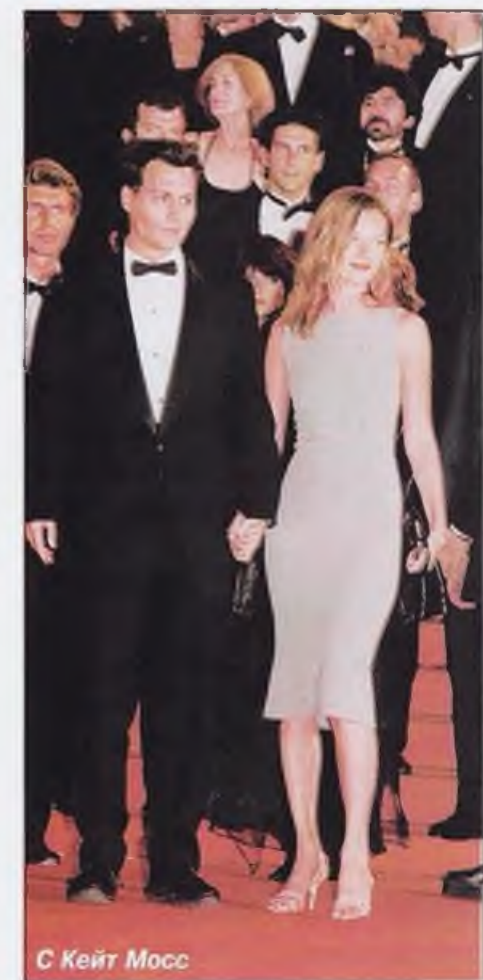
С Кейт Мосс