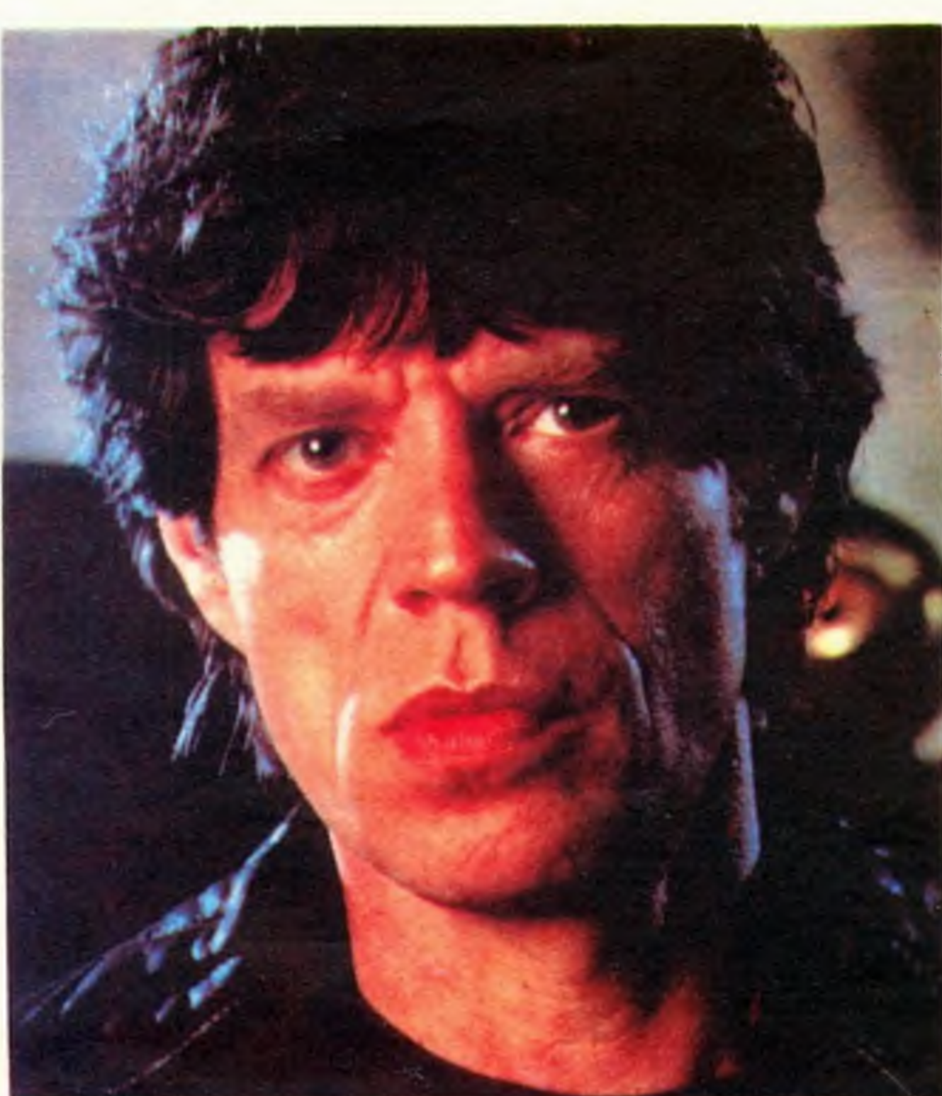
М. Джеггер в фильме «Беглец»

ленты (а они, видимо, найдутся), почему же она уступает уже названным фильмам и безнадежно лишена ощущения «высокого полета», как раз «вольности» и раскрепощенности творчества. Джеф Мерфи небестален, иначе бы он не выбрался из все-таки провинциального кино своей родины. Начав с чуть раздражающих комедийных боевиков «Дикий человек» (1975) и «Прощай, Порки Пай» (1980), постановщик зарекомендовал себя позже как мастер почти гипнотического видения реальности прошлого или будущего в авантюрных притчах «Уту» («Возмездие», 1983) и «Безмолвная земля» (1985). Но, переехав в Америку, даже добившись неплохого коммерческого успеха во второй серии вестерна «Молодые стрелки» (1990), да и в картине «Беглец», он на удивление кажется вторичным, отбавляющим уже пройденный материал, не будучи в состоянии предложить новую трактовку. Тем более поразило чем-то необычным, невиданным, по примеру тоже заезжих в Голливуде англичанина Ридли Скотта, австралийца Джорджа Миллера