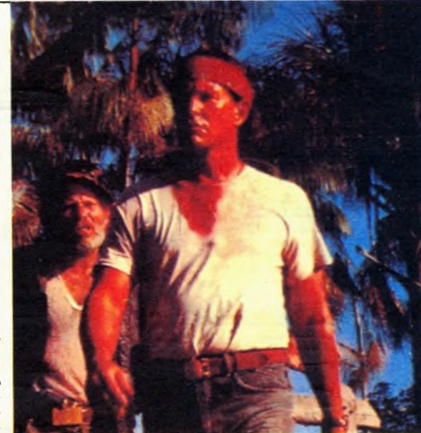
«Играя на полях Всевышнего»

В основу фильма Эктора Бабенко лег опубликованный в 1965 году роман Питера Мэтиссена об экономической и религиозной экспансии белых на землях индейцев Южной Америки. Действие фильма происходит в Бразилии. В целом лента соответствует клише «серьез-