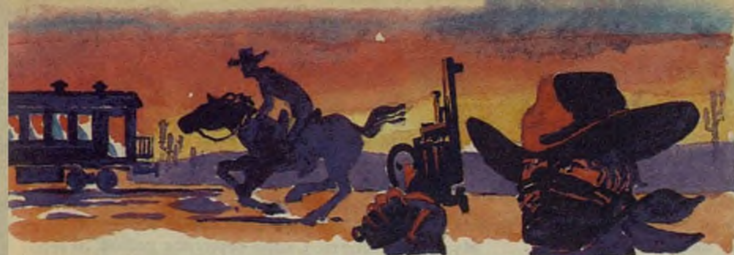
Рисунки Т. Панкеевич

Подлинный вестерн — это серьезное испытание для героев фильма. Они попадают в столь драматические обстоятельства, что их характеры раскрываются самым неожиданным образом. Так, например, режиссер Джон Форд в знаменитом фильме «Дилижанс» (1939) придумал ситуацию, когда пассажиры экипажа вынуждены все вместе обороняться от безжалостных индейцев. И казавшийся благородным мужчина оказывается трусом, а вызывающий неприязнь преступник совершает героический поступок.