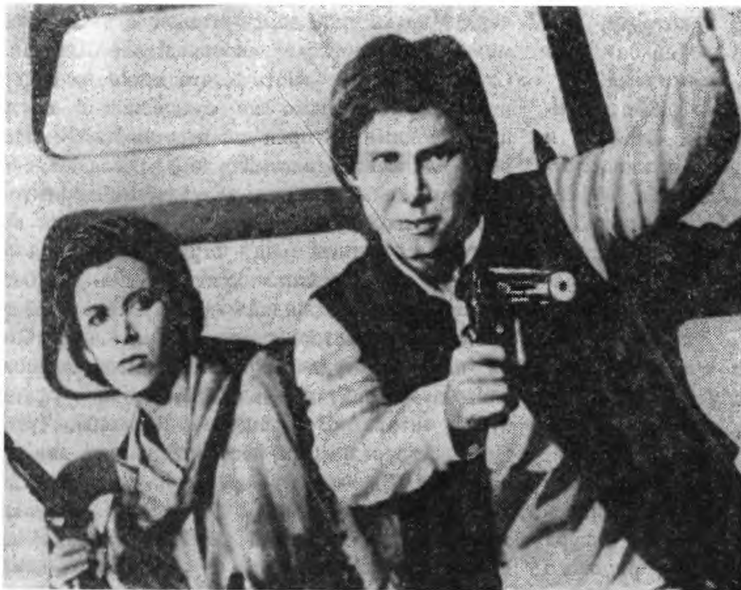
«Возвращение Джидай», режиссер Ричард Маркан

напоминала людям, что взаимопонимание между разумными существами достижимо и, если желание добиться его искренне, никакие внешние причины тут не помеха. У Маркана и Лукаса мы находим всего-навсего набор броских аттракционов (мастерски выполненных с использованием уникальной съемочной техники, включая компьютерные методы организации изображения), начисто лишенный сколько-нибудь серьезной мысли, равно как и элементарной логики.