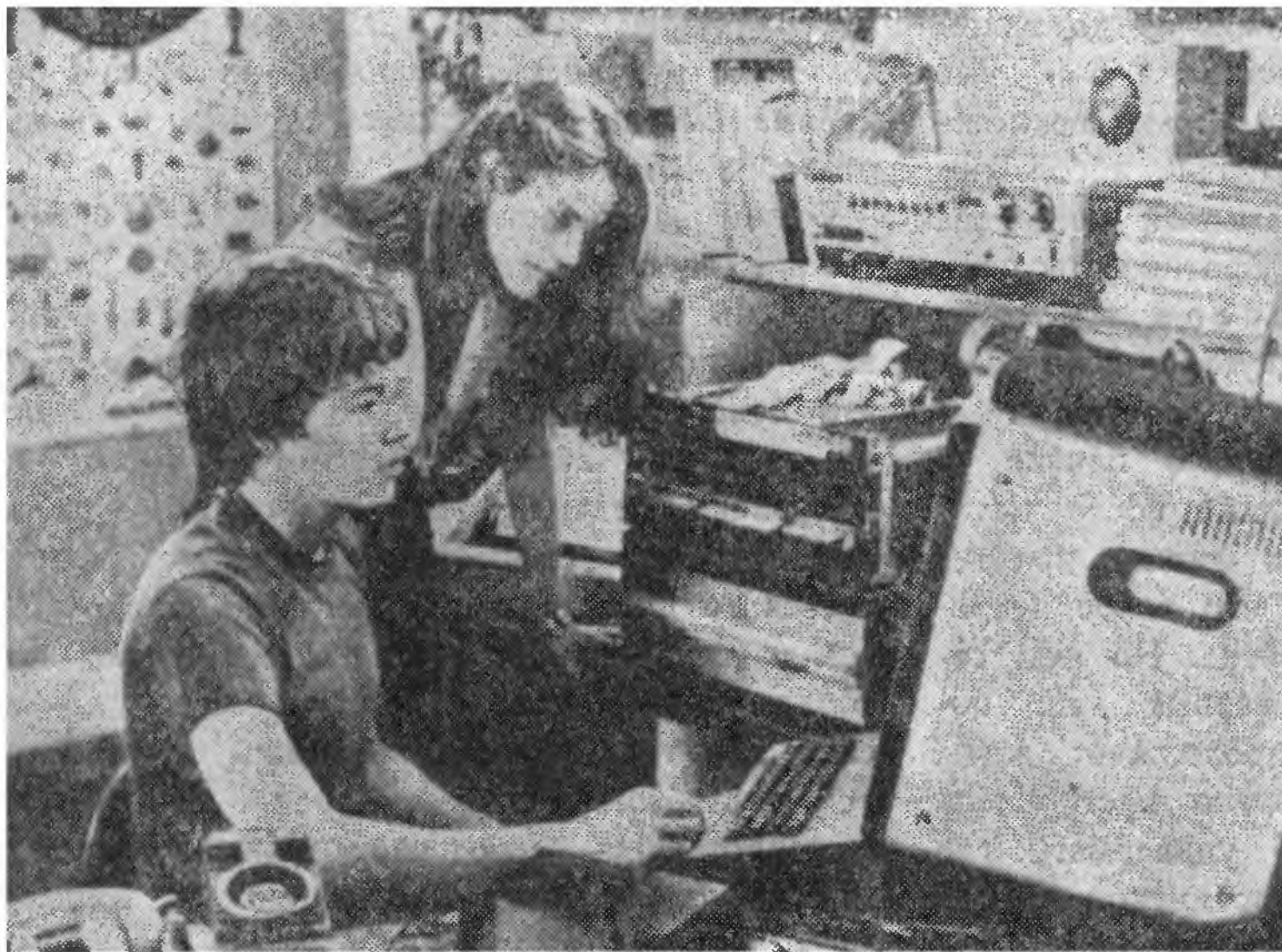
«Военные игры», режиссер Джон Бэдхем