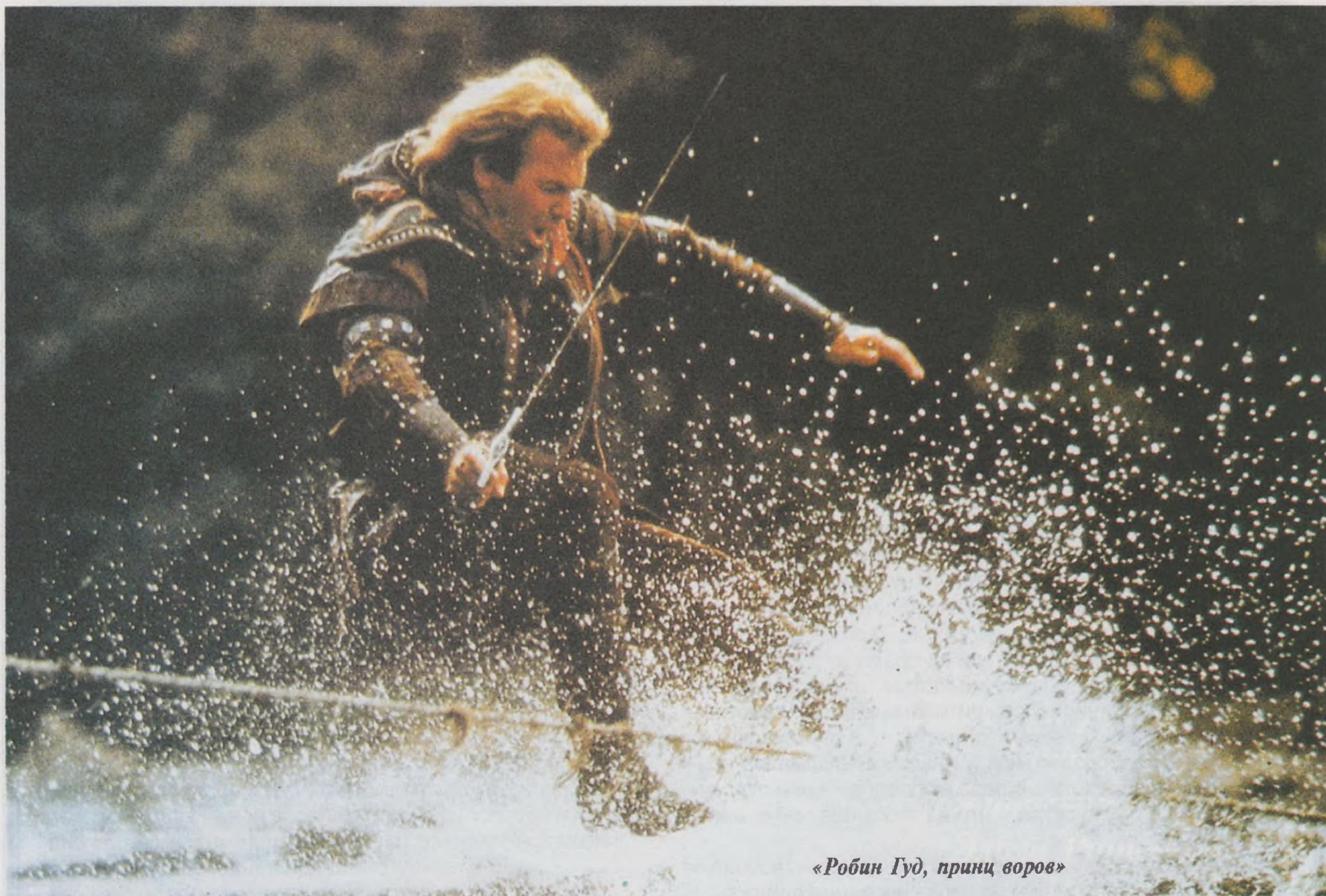
«Робин Гуд, принц воров»